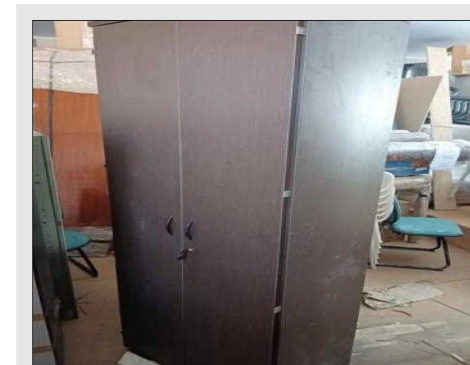
ARMARIO ALTO C/ 02 PORTAS EM FORMICA | Item: 132 |