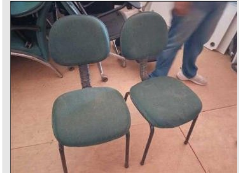
CADEIRA FIXA | Item: 751 |