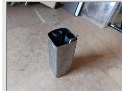
LIXEIRA ALUMÍNIO P | Item: 778 |