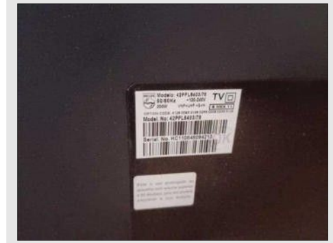
TV 42 POLEGADAS | Item: 762 |