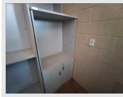
ARMARIO ALTO SEMI ABERTO MARTINUCCI | Item: 701 |