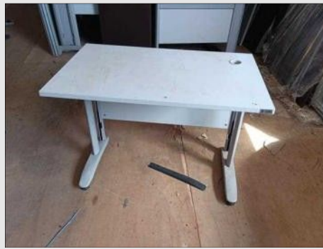
MESA LINEAR TIPO VI | Item: 591 |