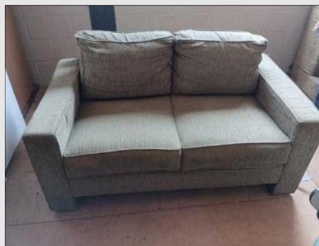
SOFA C/ 02 LUGARES PES CROMADOS | Item: 65 |