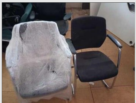
POLTRONA FIXA PES TRAPEZOIDE CROMADO | Item: 28 |