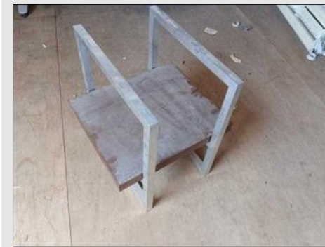
MESA DE CANTO BASE CROMADA TAMPO | Item: 67 |