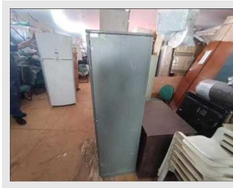
ARMÁRIO EM AÇO | Item: 782 |