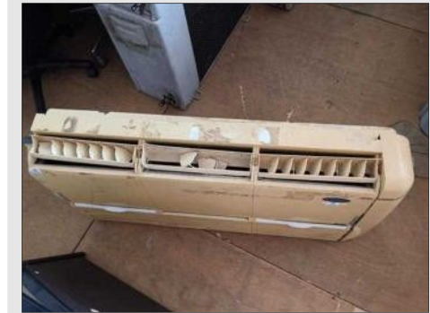
AR CONDICIONADO | Item: 447 |