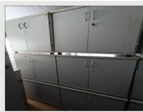
ARMARIO BAIXO C/ 02 PORTAS EM FORMICA | Item: 99 |