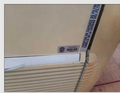
AR CONDICIONADO 9000 BTU | Item: 39 |