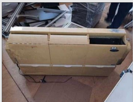
AR CONDICIONADO | Item: 376 |