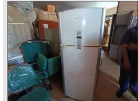
GELADEIRA ELETROLUX | Item: 748 |