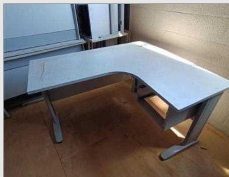
MESA EM "L" C/ 03 GAVETAS EM FORMICA | Item: 85 |