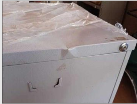
ÁRMÁRIO AÇO 4P | Item: 772 |