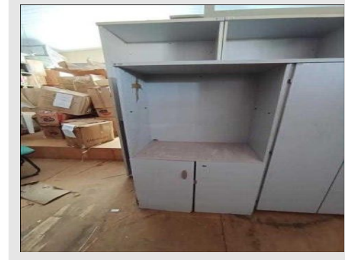
ARMARIO ALTO SEMI ABERTO MARTINUCCI | Item: 702 |