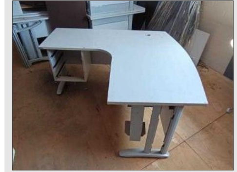
MESA EM "L" C/ 03 GAVETAS BASE FERRO | Item: 431 |