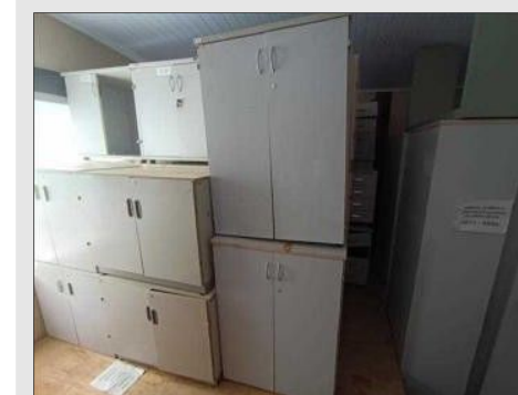
ARMARIO MEDIO C/ 02 PORTAS EM FORMICA | Item: 169 |