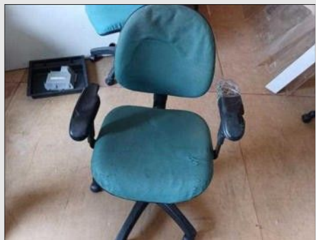
CADEIRA GIRATÓRIA C/ BRAÇO ESTOFADO | Item: 237 |