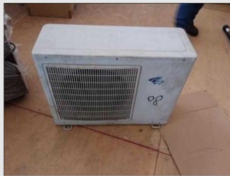
AR CONDICIONADO | Item: 196 |