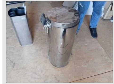
LIXEIRA ALUMÍNIO M | Item: 777 |