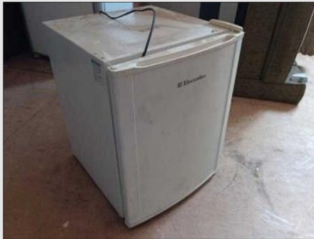
FRIGOBAR ELETROLUX | Item: 750 |