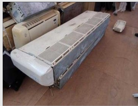
AR CONDICIONADO | Item: 21 |