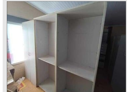
ESTANTE ALTA ABERTA 800X478X2100MM | Item: 605 |