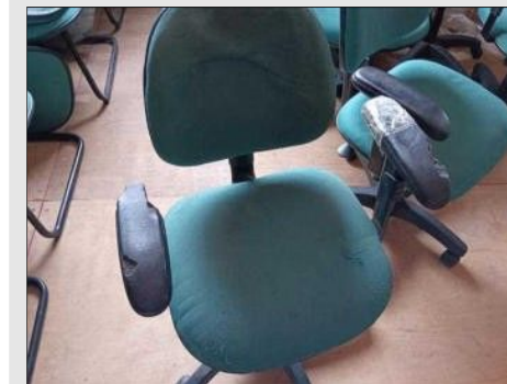
CADEIRA GIRATÓRIA C/ BRAÇO ESTOFADO | Item: 237 |