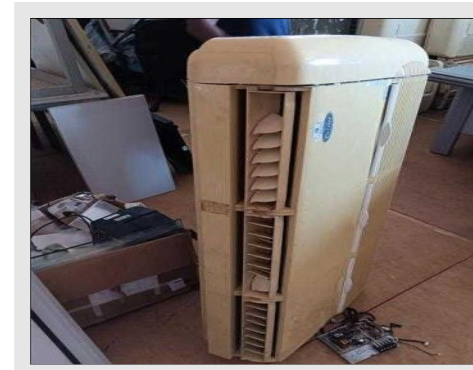
AR CONDICIONADO | Item: 768 |