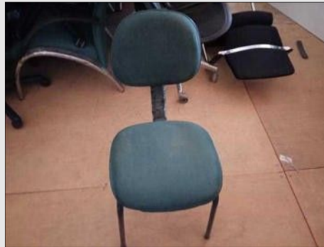
CADEIRA FIXA | Item: 751 |