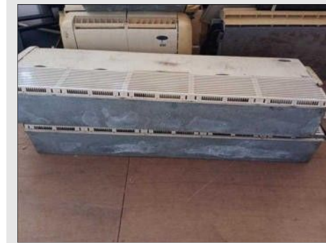
AR CONDICIONADO | Item: 21 |