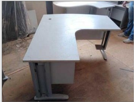
MESA EM "L" C/ 03 GAVETAS BASE FERRO | Item: 431 |