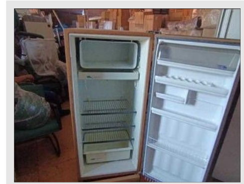
GELADEIRA CONSUL | Item: 747 |