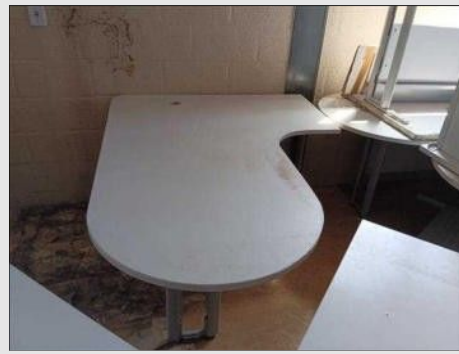
ESTAÇÃO DE TRABALHO | Item: 609 |