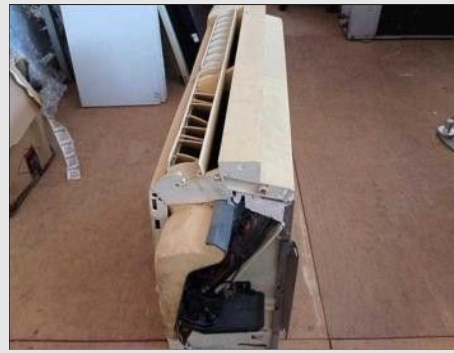
AR CONDICIONADO | Item: 429 |