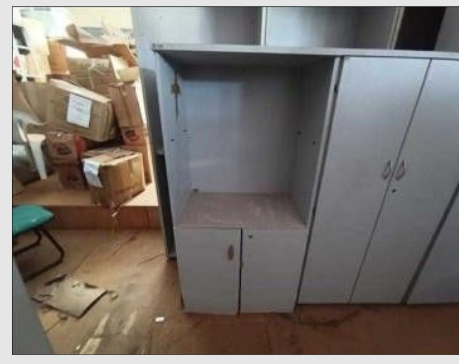
ARMARIO ALTO SEMI ABERTO MARTINUCCI | Item: 702 |