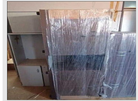
ARMARIO BAIXO SEMI ABERTO C/04 PORTAS | Item: 35