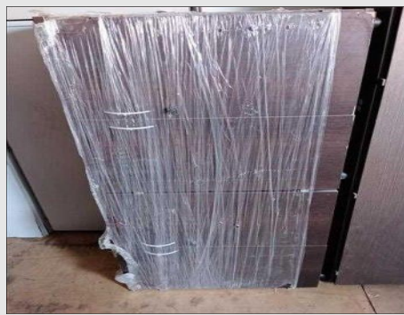
ARMARIO BAIXO C/ 04 PORTAS EM FORMICA | Item: 8 |