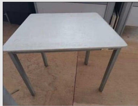
MESINHA P/ ESTUDO BASE FERRO TAMPO | Item: 53 |