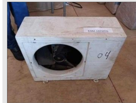
AR CONDICIONADO | Item: 274 |