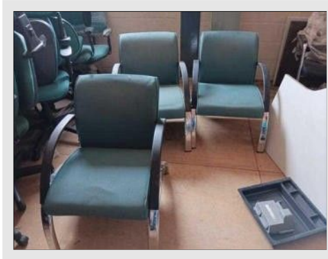
SOFA COMPONIVEL 1 LUGAR | Item: 617 |