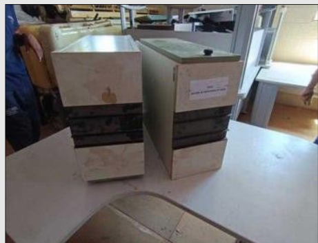
ARQUIVO C/ 01 PORTA EM FORMICA | Item: 266 |