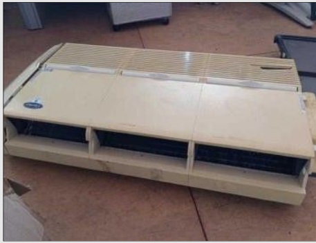
AR CONDICIONADO | Item: 766 |