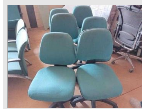
CADEIRA EXECUTIVA GIRATORIA S/ BRAÇO | Item: 41 |