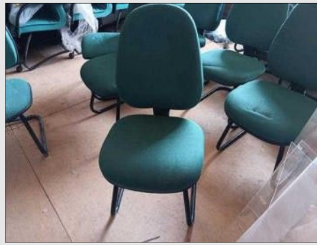
CADEIRA DIRETORZINHO PE EM S | Item: 719 |