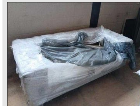
SOFÁ C/ 03 LUGARES PÉS MADEIRA | Item: 66 |