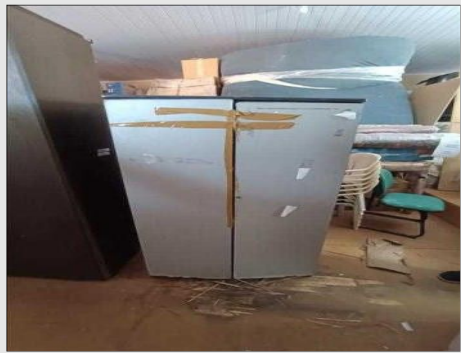
ARMÁRIO EM AÇO | Item: 782 |