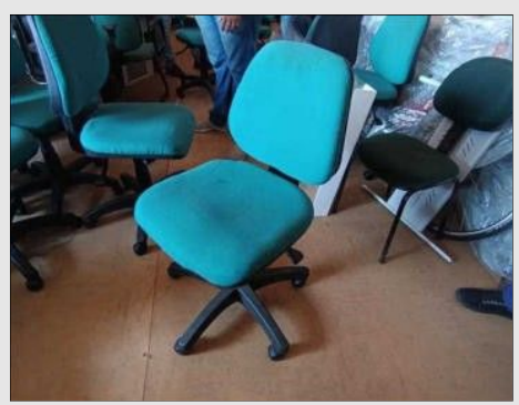
CADEIRA EXECUTIVA GIRATORIA S/ BRAÇO | Item: 41 |