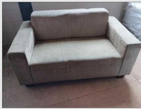
SOFA C/ 02 LUGARES PES CROMADOS | Item: 38 |