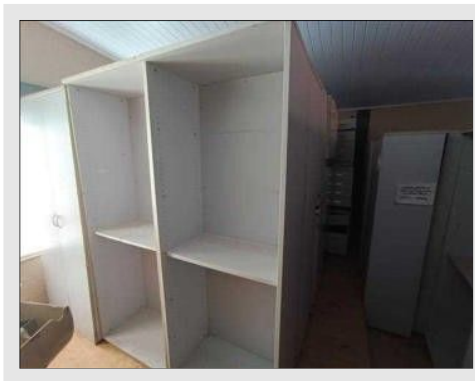
ESTANTE ALTA ABERTA 800X478X2100MM | Item: 605 |