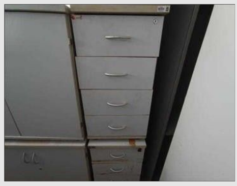
GAVETEIRO VOLANTE C/ 04 GAVETAS | Item: 130 |