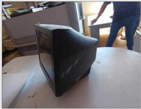
MONITOR | Item: 774 |