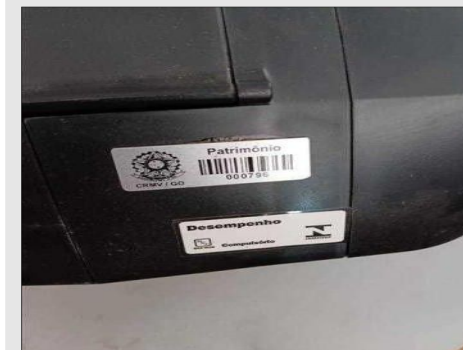
RELOGIO DE PONTO | Item: 780 |