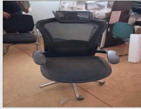
CADEIRA GIRATÓRIA ESTOFADO TECIDO | Item: 511 |