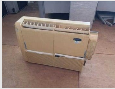
AR CONDICIONADO | Item: 429 |