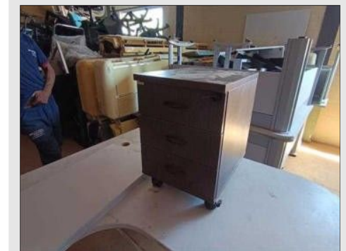
GAVETEIRO VOLANTE C/03 GAVETAS | Item: 12 |