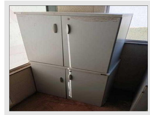
ARMÁRIO BAIXO C / 02 PORTAS EM FORMICA | Item: 453 |