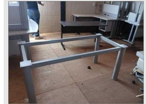
MESA P/ REUNIAO PES CROMADA TAMPO | Item: 7 |