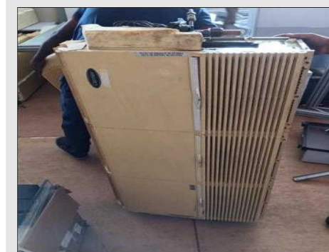
AR CONDICIONADO | Item: 770 |