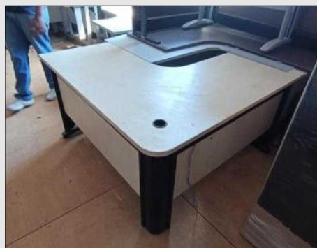
MESA EM "L" C/ 03 GAVETAS BASE FERRO | Item: 454 |