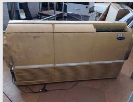
AR CONDICIONADO | Item: 376 |