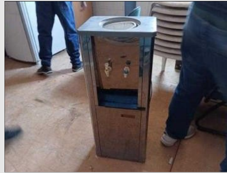
BEBEDOURO | Item: 749 |