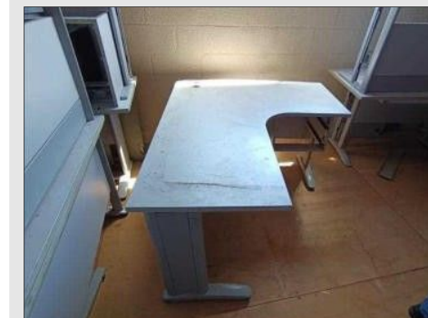
MESA EM "L" C/ 03 GAVETAS EM FORMICA | Item: 85 |