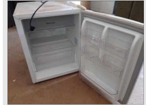
FRIGOBAR ELETROLUX | Item: 750 |