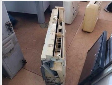
AR CONDICIONADO | Item: 447 |