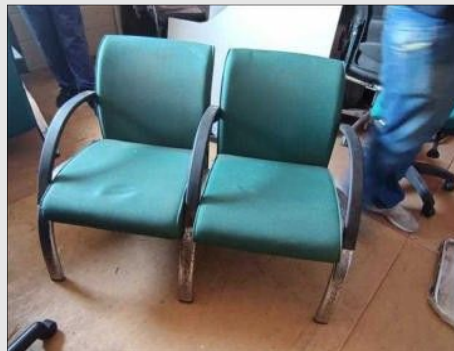
SOFA COMPONIVEL 2 LUGARES | Item: 614 |