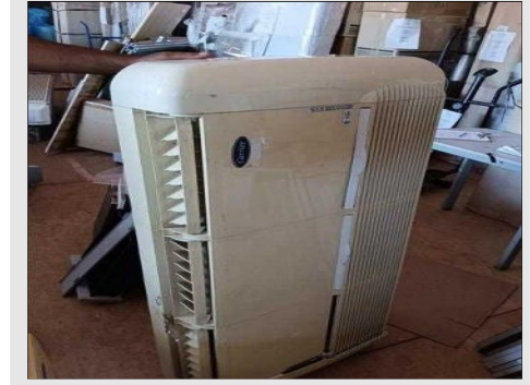
AR CONDICIONADO | Item: 765 |