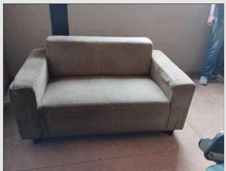
SOFA C/ 02 LUGARES PES CROMADOS | Item: 64 |