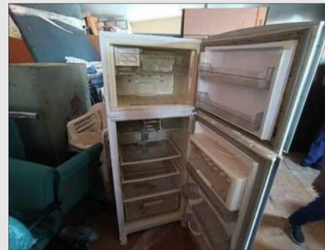
GELADEIRA ELETROLUX | Item: 748 |