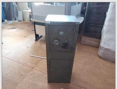
COFRE DE AÇO C/02 PORTAS COR VERDE | Item: 52 |