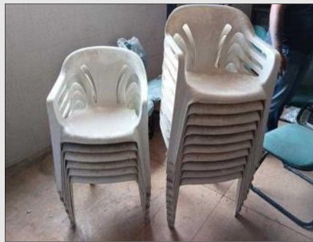
CADEIRA C/ BRAÇO BRANCO MARFINITE | Item: 477 |