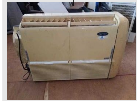
AR CONDICIONADO 9000 BTU | Item: 39 |