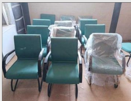
POLTRONA FIXA ESPALADAR MEDIO C/ BRAÇO | Item: 397 |