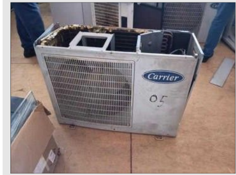
AR CONDICIONADO | Item: 764 |