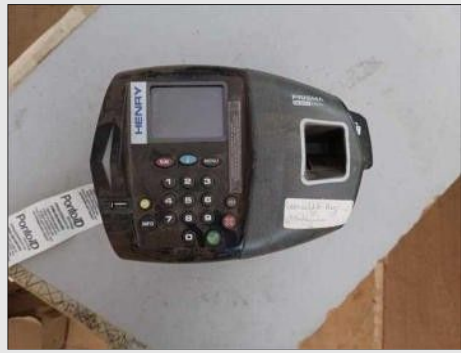
RELOGIO DE PONTO | Item: 780 |