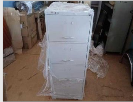
ÁRMÁRIO AÇO 4P | Item: 772 |