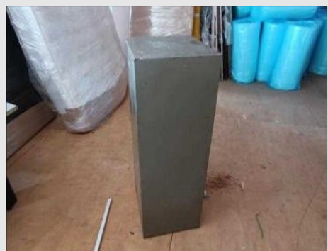
COFRE DE AÇO C/02 PORTAS COR VERDE | Item: 52 |