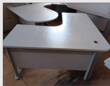
MESA EM "L" S/ GAVETAS EM FORMICA CINZA | Item: 147 |