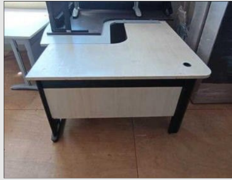
MESA EM "L" C/ 03 GAVETAS BASE FERRO | Item: 454 |