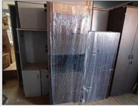
ARMARIO BAIXO SEMI ABERTO C/04 PORTAS | Item: 35 |