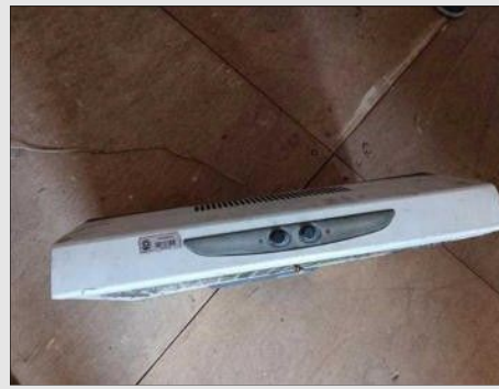
EXUSTOR DE FOGÃO TWIST | Item: 470 |