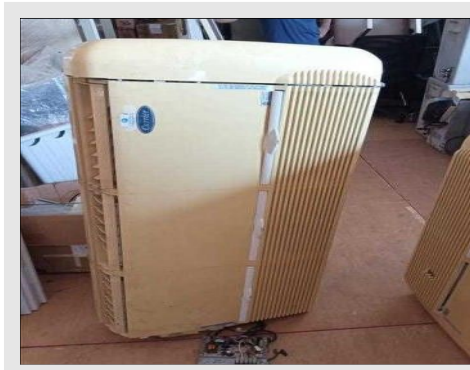
AR CONDICIONADO | Item: 768 |