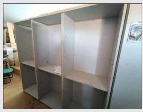
ESTANTE ALTA ABERTA 800X478X2100MM | Item: 607 |