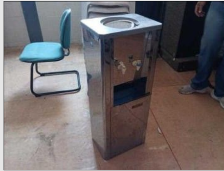
BEBEDOURO | Item: 749 |