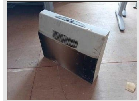
EXUSTOR DE FOGÃO TWIST | Item: 470 |