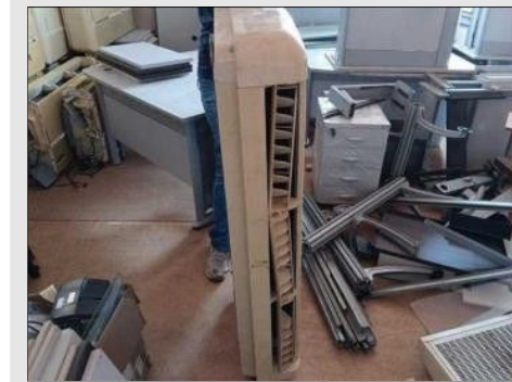
AR CONDICIONADO | Item: 376 |