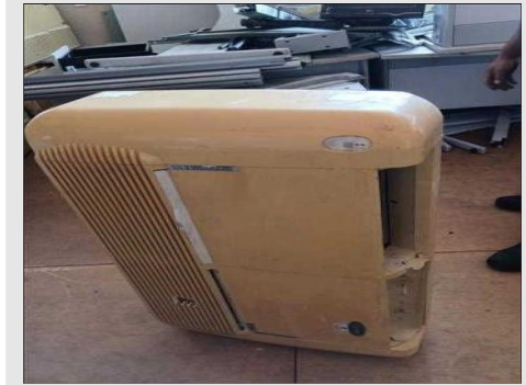
AR CONDICIONADO | Item: 767 |