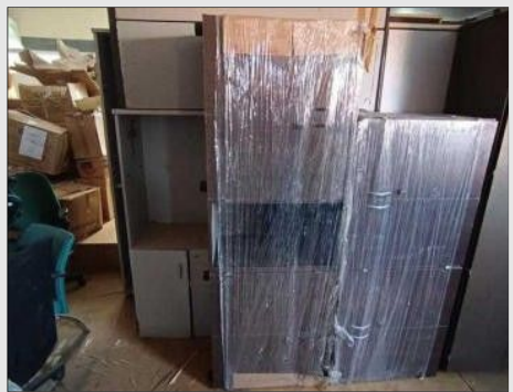
ARMARIO BAIXO SEMI ABERTO C/04 PORTAS | Item: 35 |