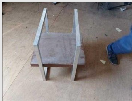
MESA DE CANTO BASE CROMADA TAMPO | Item: 67 |