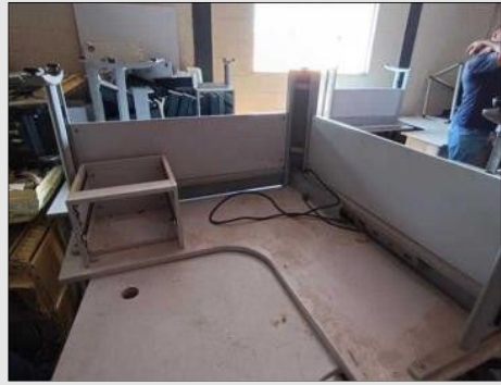
ESTAÇÃO DE TRABALHO | Item: 609 |