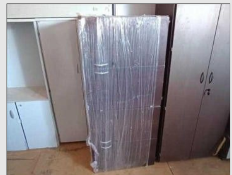
ARMARIO BAIXO C/ 04 PORTAS EM FORMICA | Item: 8 |