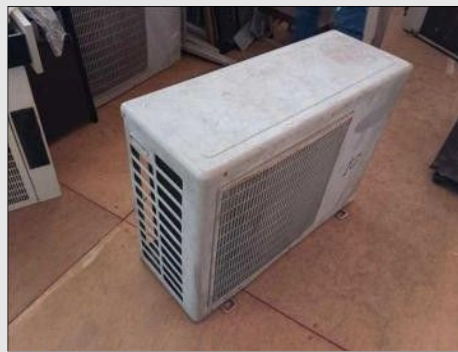
AR CONDICIONADO | Item: 375 |