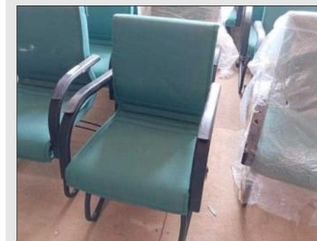
POLTRONA FIXA ESPALADAR MEDIO C/ BRAÇO | Item: 397 |