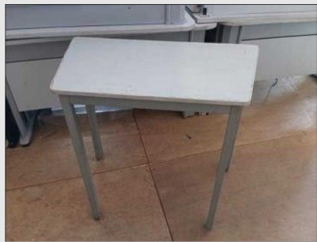
MESINHA P/ ESTUDO BASE FERRO TAMPO | Item: 53 |