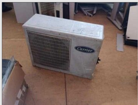
AR CONDICIONADO | Item: 70 |