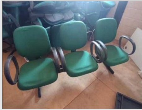
LONGARINA 3 CADEIRAS | Item: 755 |