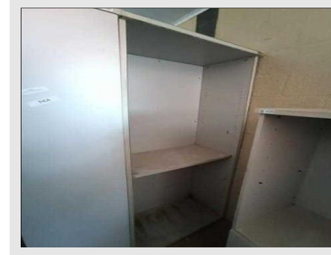
ESTANTE ALTA ABERTA 800X478X2100MM | Item: 608 |