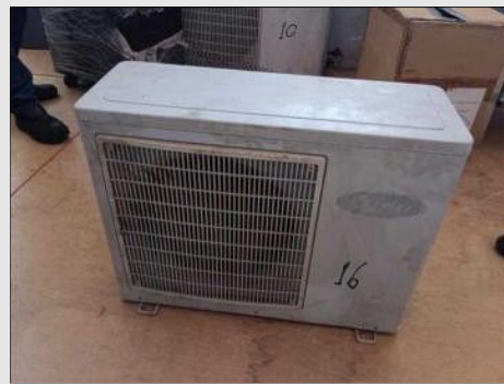
AR CONDICIONADO | Item: 282 |