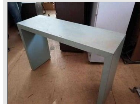
APARADOR EM FORMICA | Item: 290 |