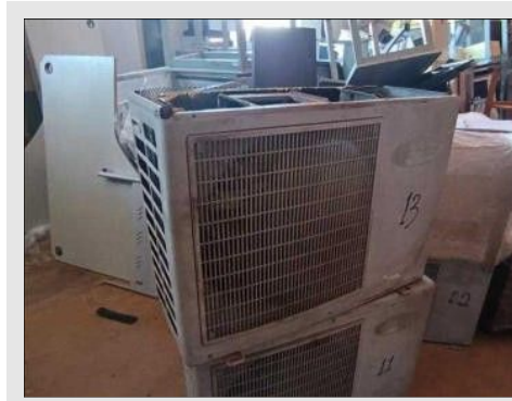
AR CONDICIONADO | Item: 109 |