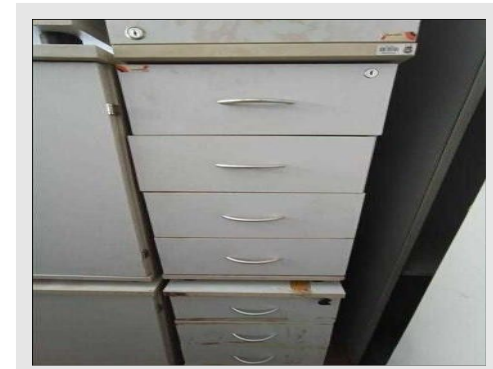
GAVETEIRO VOLANTE C/ 04 GAVETAS | Item: 130 |