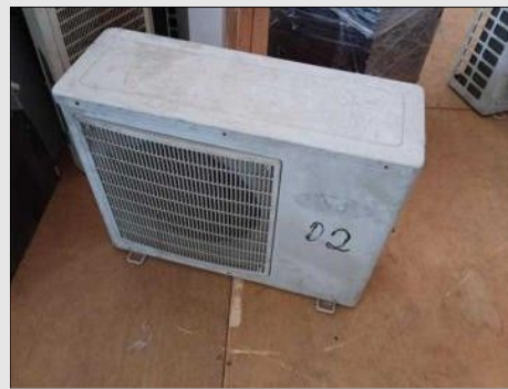
AR CONDICIONADO | Item: 208 |