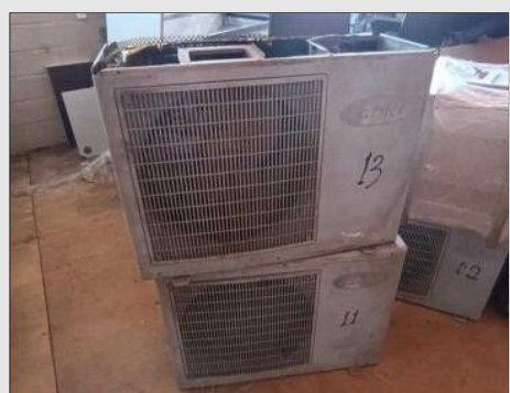
AR CONDICIONADO | Item: 134 |