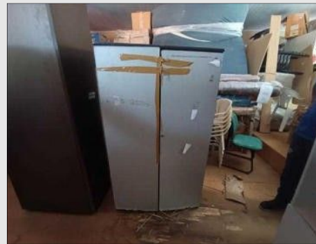
ARMÁRIO EM AÇO | Item: 782 |