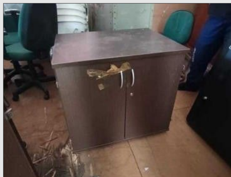
ARMARIO BAIXO C/ 02 PORTAS EM FORMICA | Item: 270 |