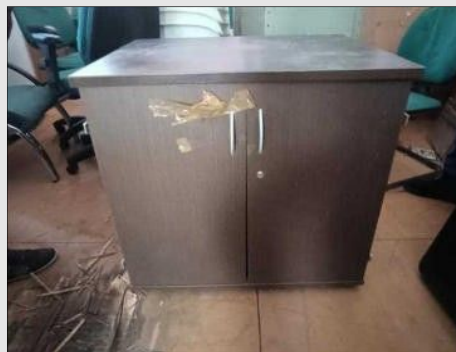
ARMARIO BAIXO C/ 02 PORTAS EM FORMICA | Item: 270 |