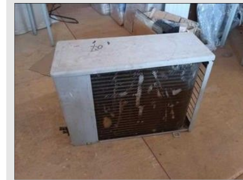
AR CONDICIONADO | Item: 70 |