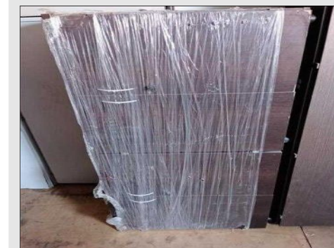
ARMARIO BAIXO C/ 02 PORTAS EM FORMICA | Item: 270 |