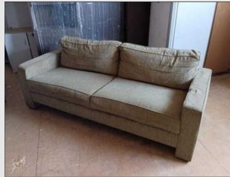
SOFÁ C/ 02 LUGARES PÉS MADEIRA | Item: 449 |