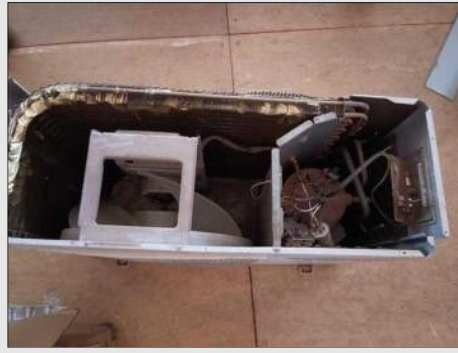
AR CONDICIONADO | Item: 764 |