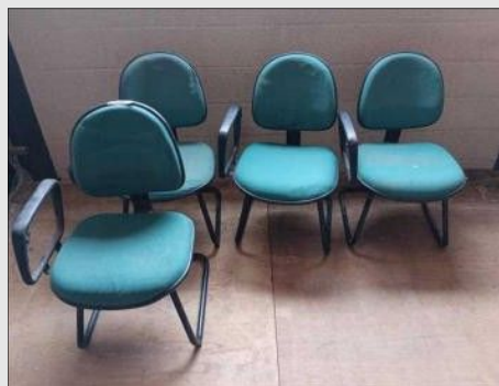
CADEIRA FIXA PÉS TRAPEZOIDE C/ | Item: 310 |