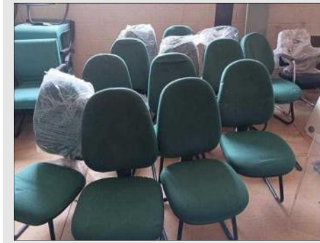
CADEIRA DIRETORZINHO PE EM S | Item: 719 |