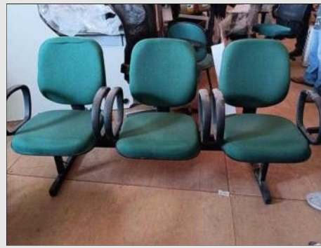
LONGARINA 3 CADEIRAS | Item: 755 |