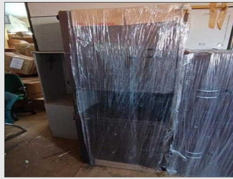
ARMARIO BAIXO SEMI ABERTO C/04 PORTAS | Item: 35 |