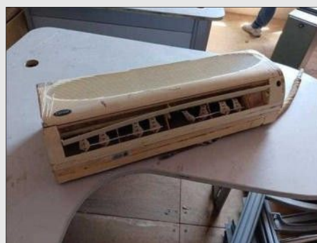
AR CONDICIONADO | Item: 769 |