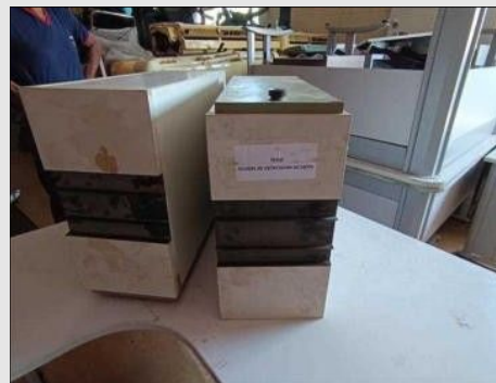
ARQUIVO C/ 01 PORTA EM FORMICA | Item: 266 |