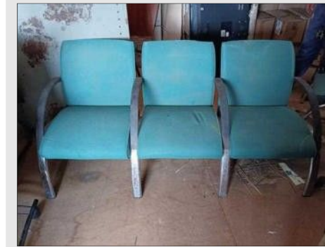
SOFA COMPONIVEL 03 LUGARES | Item: 615 |