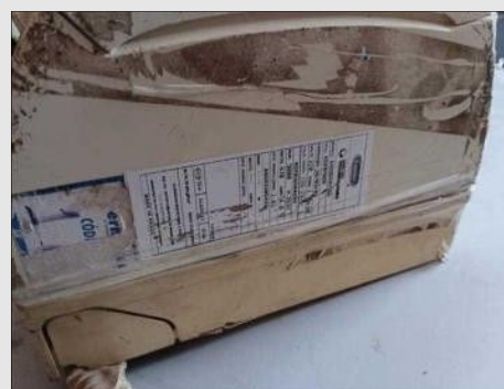
AR CONDICIONADO | Item: 769 |