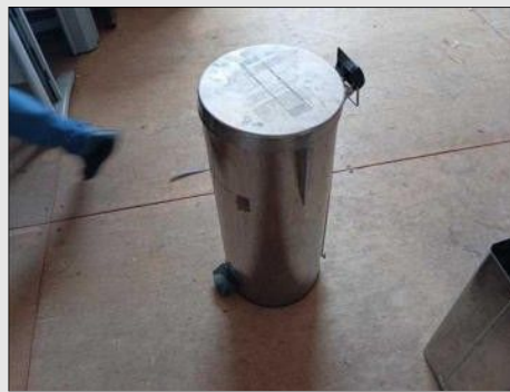
LIXEIRA ALUMÍNIO M | Item: 777 |