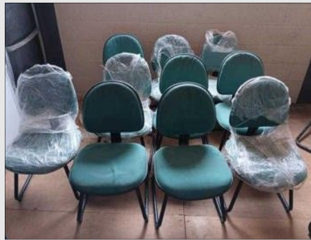
CADEIRA FIXA PES TRAPEZOIDE ESTOFADO | Item: 1 |