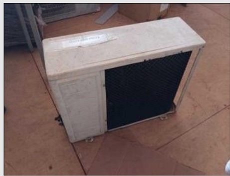
AR CONDICIONADO | Item: 274 |