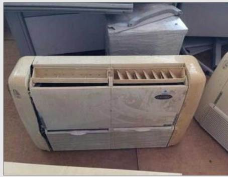
AR CONDICIONADO | Item: 763 |