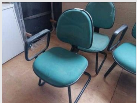
CADEIRA FIXA PÉS TRAPEZOIDE C/ | Item: 310 |