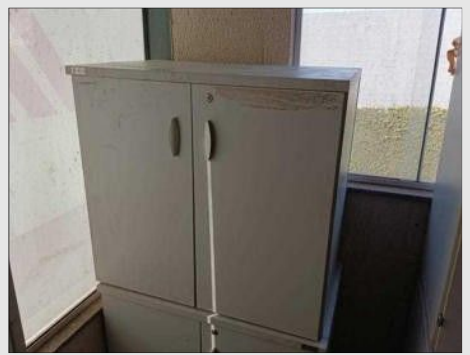
ARMÁRIO BAIXO C / 02 PORTAS EM FORMICA | Item: 453 |