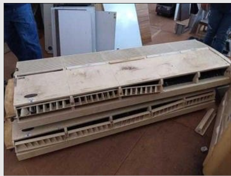
AR CONDICIONADO | Item: 21 |