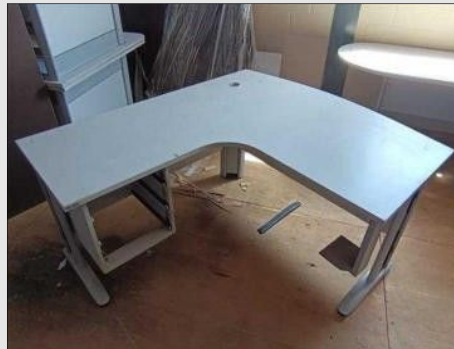
MESA EM "L" C/ 03 GAVETAS BASE FERRO | Item: 431 |