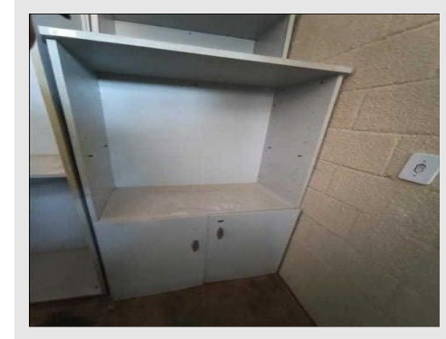
ARMARIO ALTO SEMI ABERTO MARTINUCCI | Item: 701 |