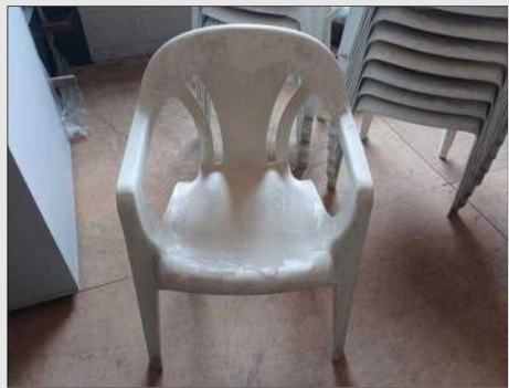
CADEIRA C/ BRAÇO BRANCO MARFINITE | Item: 477 |