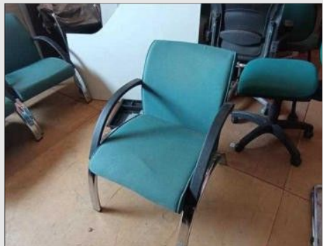
SOFA COMPONIVEL 1 LUGAR | Item: 613 |