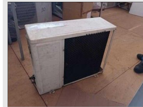
AR CONDICIONADO | Item: 208 |