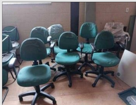
CADEIRA GIRATÓRIA C/ BRAÇO ESTOFADO | Item: 237 |