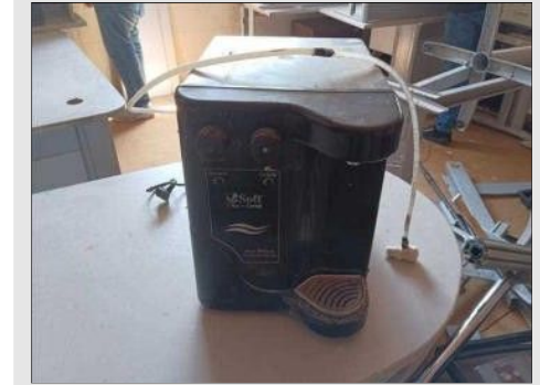
PURIFICADOR DE ÁGUA SOFT | Item: 773 |