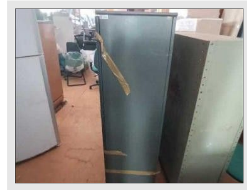
ARMÁRIO EM AÇO | Item: 782 |