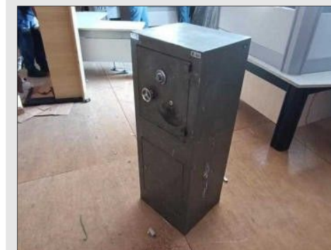
COFRE DE AÇO C/02 PORTAS COR VERDE | Item: 52 |