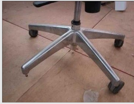
CADEIRA GIRATÓRIA ESTOFADO TECIDO | Item: 511 |