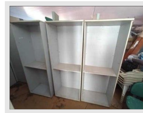
ESTANTE ALTA ABERTA 800X478X2100MM | Item: 606 |