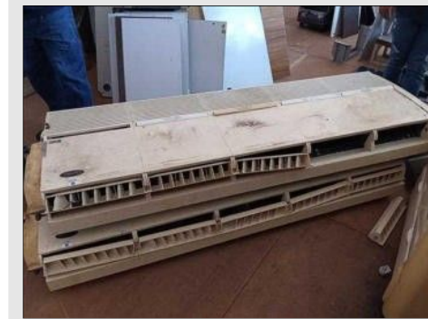
AR CONDICIONADO | Item: 56 |