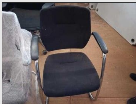
POLTRONA FIXA PES TRAPEZOIDE CROMADO | Item: 28 |