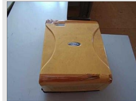
PABX ACTIVE MDS LEUCOTRON | Item: 783 |