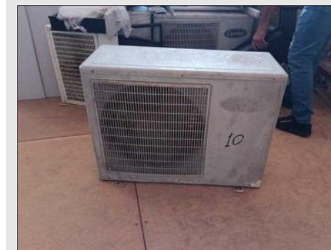
AR CONDICIONADO | Item: 375 |