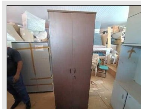
ARMARIO ALTO C/ 02 PORTAS EM FORMICA | Item: 132 |