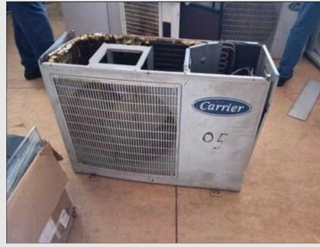
AR CONDICIONADO | Item: 764 |