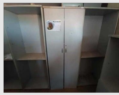
ESTANTE ALTA ABERTA 800X478X2100MM | Item: 608 |