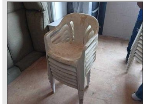
CADEIRA C/ BRAÇO BRANCO MARFINITE | Item: 478 |