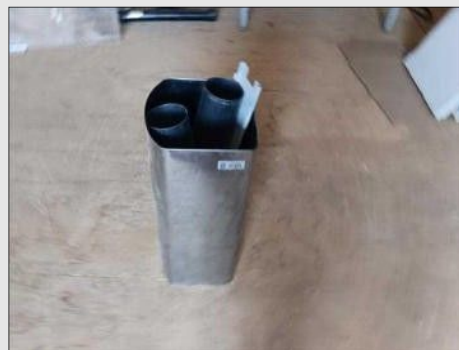
LIXEIRA ALUMÍNIO P | Item: 778 |