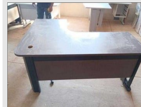
MESA S/ GAVETAS EM FORMICA MARROM | Item: 33 |