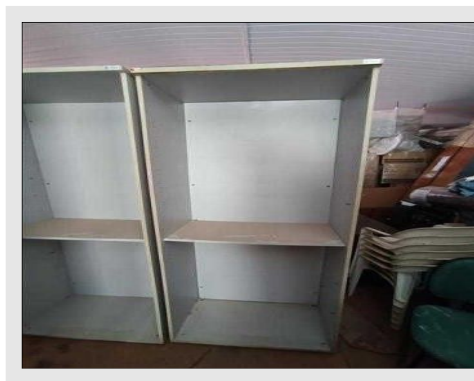
ESTANTE ALTA ABERTA 800X478X2100MM | Item: 606 |