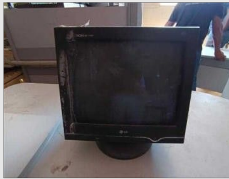
MONITOR | Item: 774 |