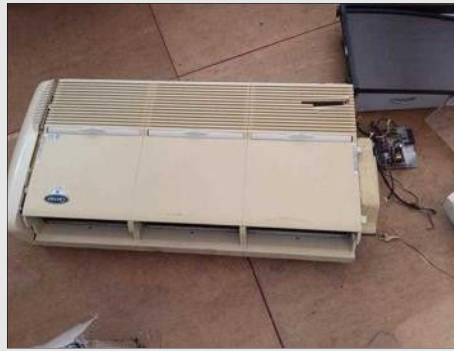
AR CONDICIONADO | Item: 766 |