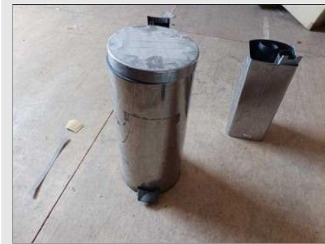
LIXEIRA ALUMÍNIO M | Item: 777 |