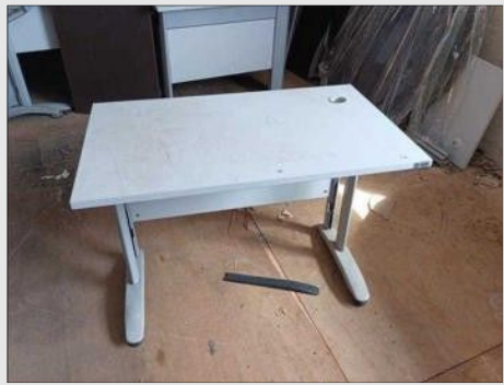
MESA LINEAR TIPO VI | Item: 591 |