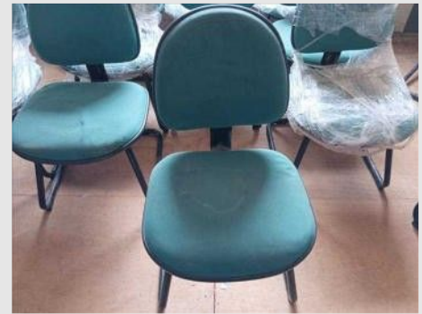
CADEIRA FIXA PES TRAPEZOIDE ESTOFADO | Item: 1 |