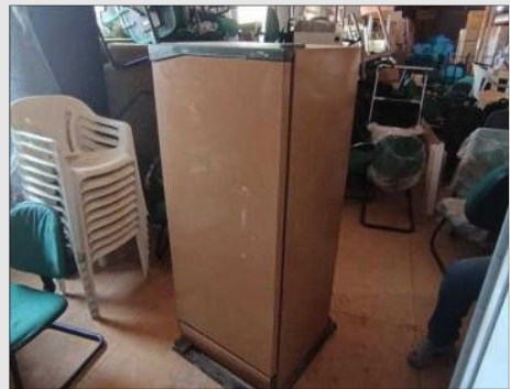
GELADEIRA CONSUL | Item: 747 |