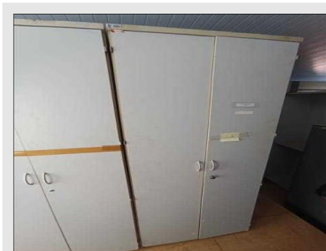
ARMARIO ALTO C/ 02 PORTAS EM FORMICA | Item: 131 |