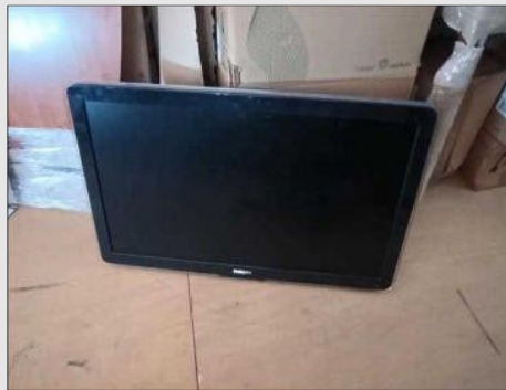
TV 42 POLEGADAS | Item: 762 |