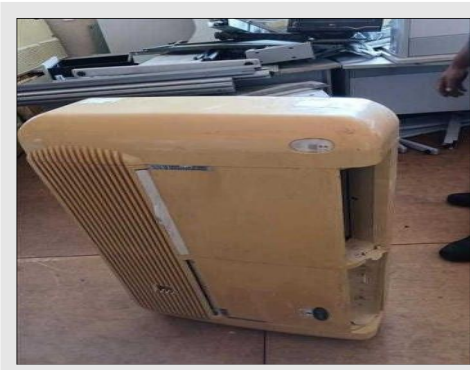
AR CONDICIONADO | Item: 767 |