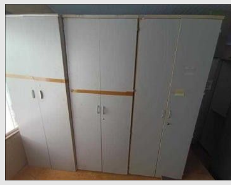
ARMARIO ALTO C/ 02 PORTAS EM FORMICA | Item: 131 |