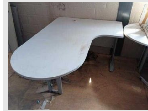
ESTAÇÃO DE TRABALHO | Item: 609 |